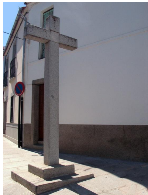
Fotografía actual de “Cruz del Cerro”

Su enclave en un lugar elevado ha presentado desde siempre un gran atractivo para la religiosidad popular y ha estado vinculada a lo largo de la historia con numerosos rituales religiosos, como por ejemplo el Vía Crucis del Nazareno en la madrugada del Viernes Santo, con la Romería de la Virgen de Luna y la procesión del Corpus Christi.