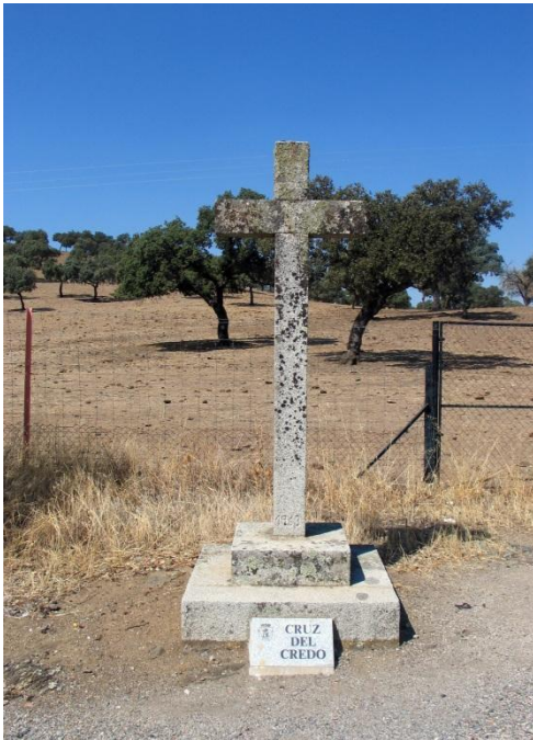
Fotografía actual de la "Cruz del Credo"

Se encuentra localizada en el término de Añora en el paraje conocido como "Cerro Castillo" en la carretera de Villaharta, en el último punto desde donde se pueden divisar la localidad de Pozoblanco. Es una cruz esculpida en piedra de granito, con basamento escalonado en el que se asienta la columna.