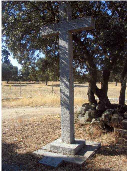
Fotografía actual de la “Cruz de Venta Caída”

Tiene simbología religiosa ya que forma parte del ritual para la romería de la Virgen de Luna. En las proximidades de la cruz, la cofradía de la Virgen de Luna con todos sus hermanos rompe filas en la “romería de llevada” de la virgen y establecen la formación de las filas en la “romería de traída”.