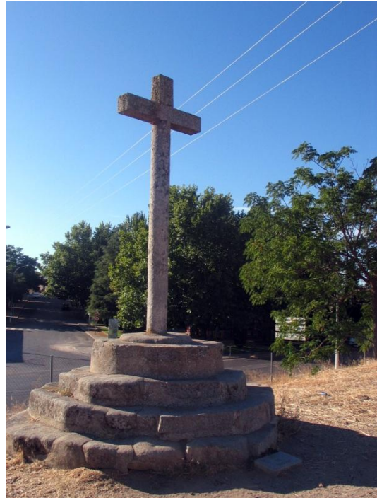
Fotografía actual de la “Cruz del Becerril”