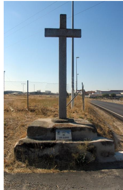
Fotografía actual de la “Cruz de los Llanos”