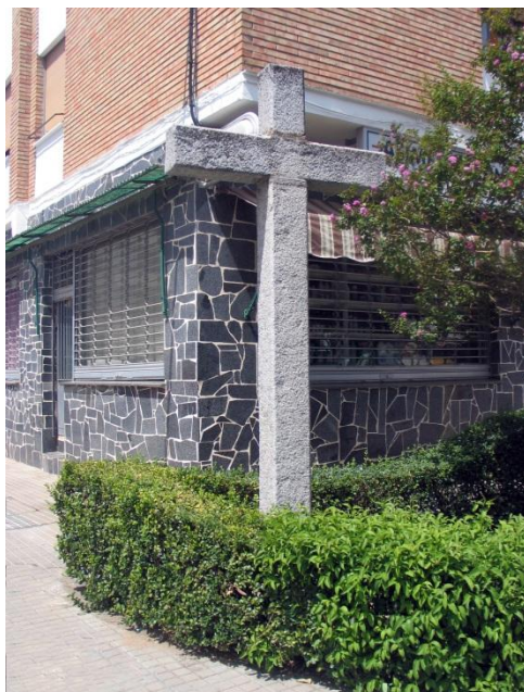
Fotografía actual de la “Cruz de Arévalo”

Cruz situada en la Ronda los Muñoces en la esquina con la calle Huelva. La primera documentación que data su existencia es del año 1652 y se cree según documentos que es reformada en 1728.