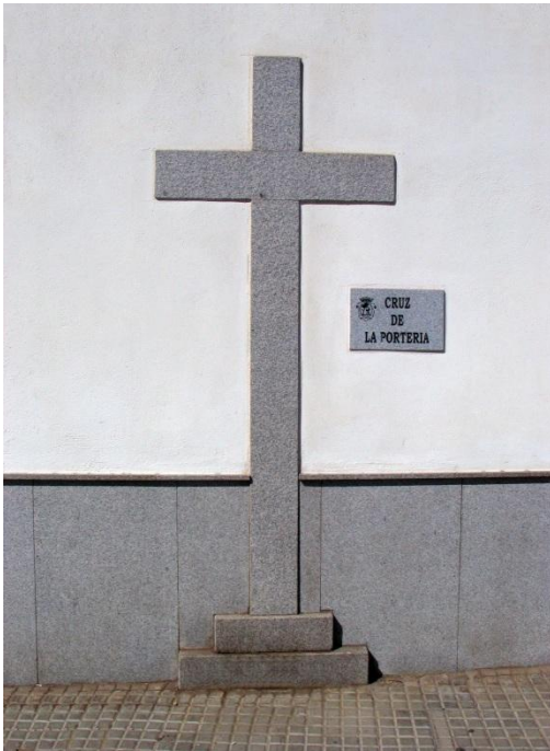
Fotografía actual de la “Cruz de la Portería”