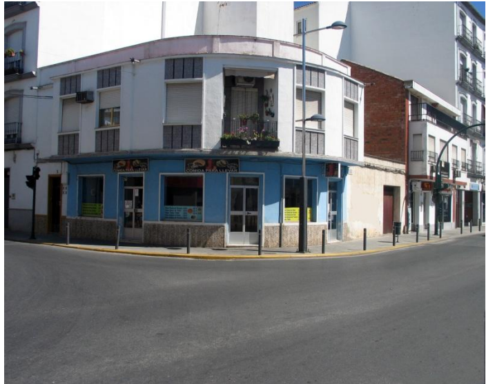
Fotografía del lugar en la actualidad donde se encontraba la “Cruz el Lejío”