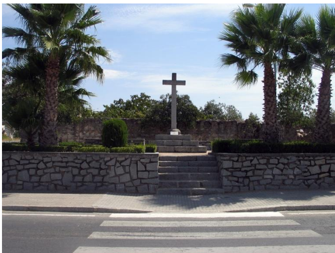
Fotografía actual de la "Cruz del Torilejo"

También conocida como "Cruz del Cantalejo". Su construcción fue datada en el año 1754 y se localiza en la intersección de la calle Encrucijada y el camino de Matajacas. Se denomina cruz del Torilejo porque toma el nombre del lugar donde se encuentra erigida.