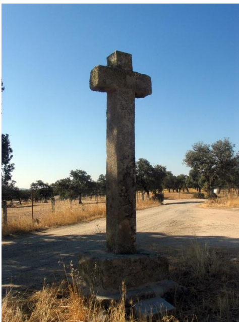
Fotografía actual de la "Cruz del Portezuelo"

Situada en el margen derecho de la carretera del Cerro las Obejuelas Km 2.5, junto al Camino de las Cuatro Casillas. Toma del nombre del Portezuelo por la zona en la que se encuentra que es conocida por dicho nombre.