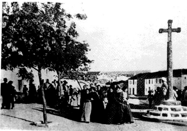
Fotografía de la desaparecida “Cruz de San Gregorio”