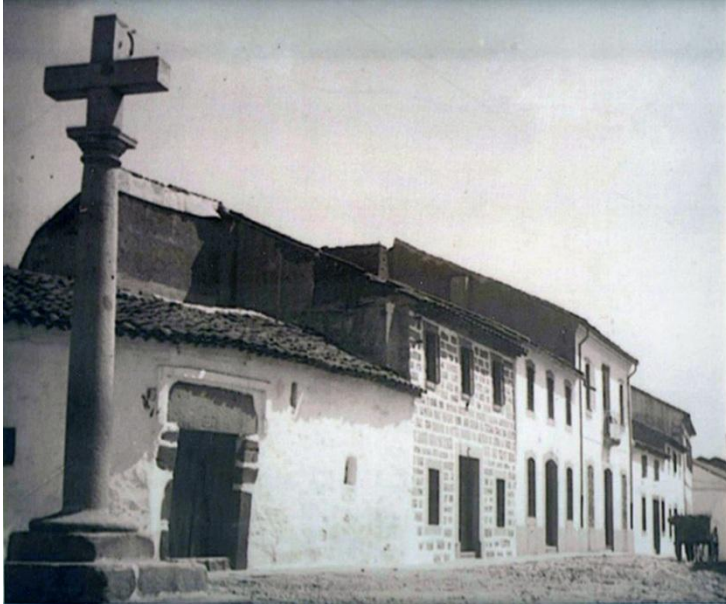
Fotografía antigua de la "Cruz del Risquillo"

Esta cruz era el lugar en el que en los entierros el cura de Santa Catalina abandonaba el cortejo fúnebre y se hacía cargo de este el capellán del cementerio.