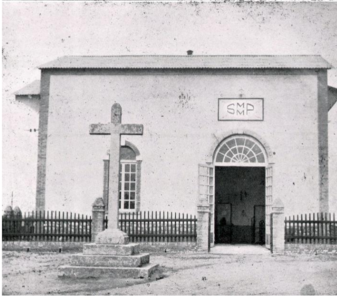
Fotografía antigua de la “Cruz de Hierro”

Su construcción data del 1822. Originalmente esta cruz se encontraba en el antiguo cementerio de Pozoblanco ubicado en la zona del “Campo Chico”. En 1923 la cruz se trasladó a su lugar actual conocido como “cercado de hierro” de ahí proviene su nombre de “Cruz de Hierro”.