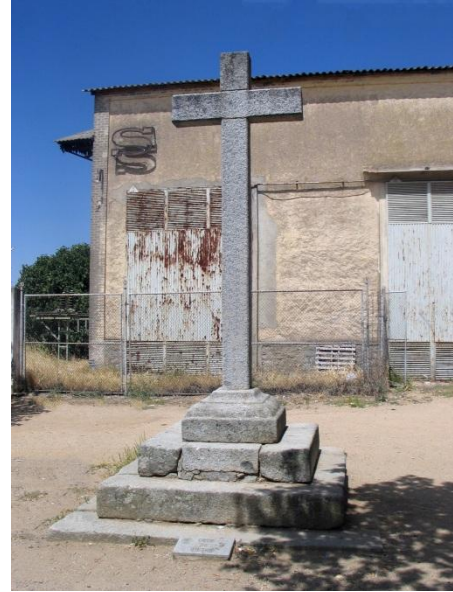
Fotografía actual de la “Cruz de Hierro”