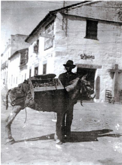
Fotografía de la desaparecida “Cruz del Lejío”

Se encontraba formando parte de la vía sacra que nacía en esta cruz y transcurría siguiendo todo el camino de la circunvalación conocido a finales del siglo XIX como callejón Ancho, hasta llegar al cementerio viejo. Esta vía sacra era la seguida por la cofradía de la “Vera Cruz” para cumplimentar sus actos públicos de suplicio.