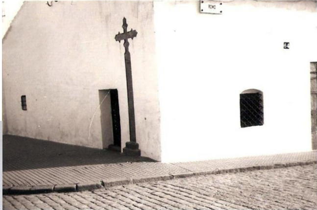
Fotografía antigua de la “Cruz de la Portería”

Conocida desde antiguo como “Cruz del Pilar”, se encontraba situada en mitad de la encrucijada que formaban las actuales calles de la Feria, Obispo Osio y San Sebastián, y luego colocada en las proximidades de los edificios, cuando por su situación obstaculizaba el libre deambular de carros y acémilas.