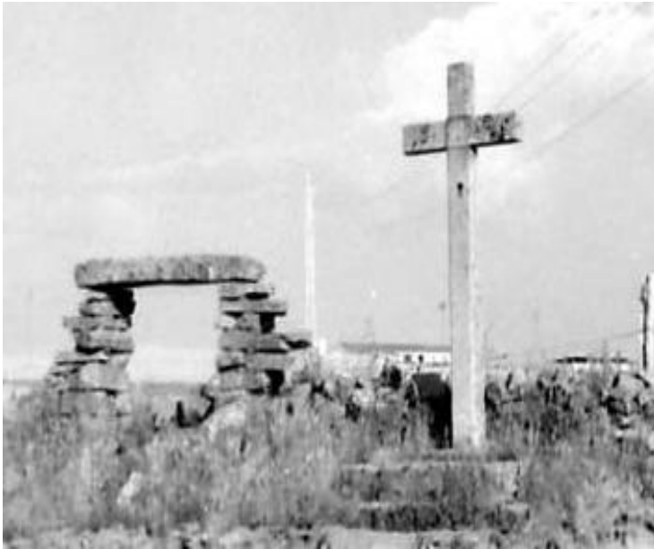
Fotografía antigua de la “Cruz de los Llanos”

Pertenece al tipo de cruces conocidas como de término que se localizan en la salida de los pueblos. Los habitantes de los poblamientos donde estas se localizaban, creían que este tipo de cruces protegían la localidad de enfermedades y la miseria.