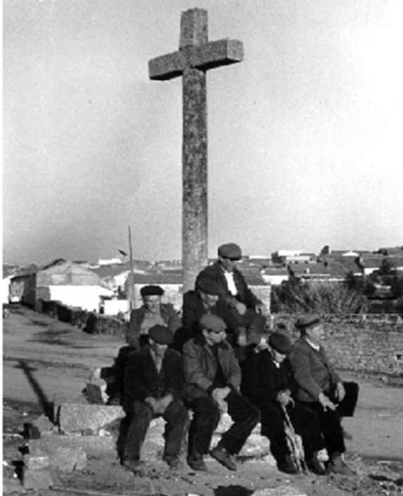
Fotografía antigua de la “Cruz del Becerril”

Esta cruz de granito también es conocida “Burrete” o del “Ciento” haciendo este último nombre alusión al prostíbulo conocido como “El Ciento”, nombre recibido por el lugar que ocupaba en la calle.