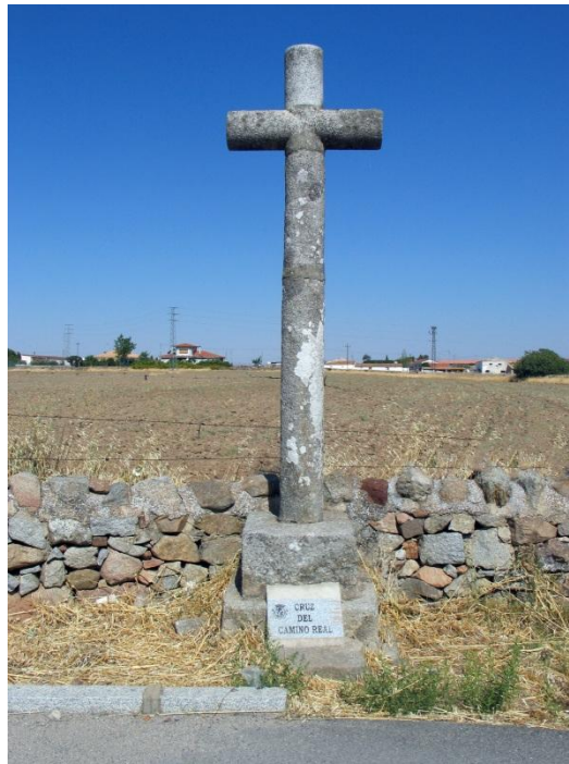
Fotografía actual de la "Cruz del Camino Real a Pedroche"

Existe documentación que data su existencia desde 1615. En 1953 la cruz fue reconstruida por Antonio Ruiz Sánchez. Se localiza en el km 1 de la carretera de Pedroche. Pertenece a las llamadas cruz de término situada a la salida de la población. Los habitantes de los poblamientos donde estas se localizaban, creían que este tipo de cruces protegían la localidad de enfermedades y la miseria.