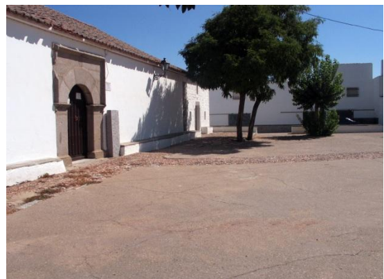
Fotografía del lugar en la actualidad donde se encontraba la “Cruz de San Gregorio”

Cruz desaparecida en la actualidad. Se localizaba en la explanada de la “ermita de San Gregorio”.