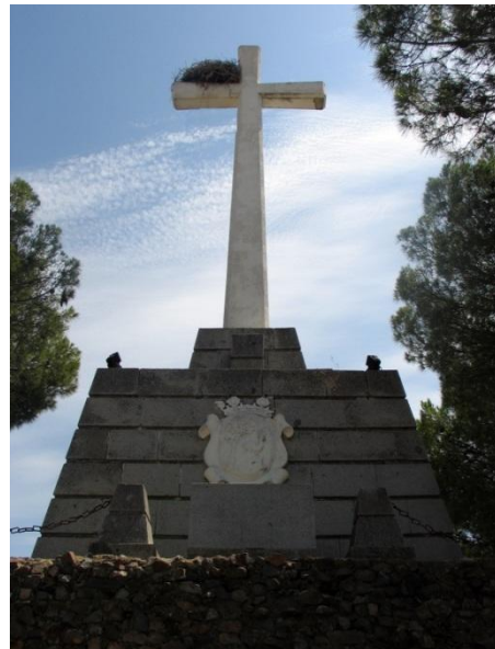
Fotografía actual de la “Cruz de la Unidad”