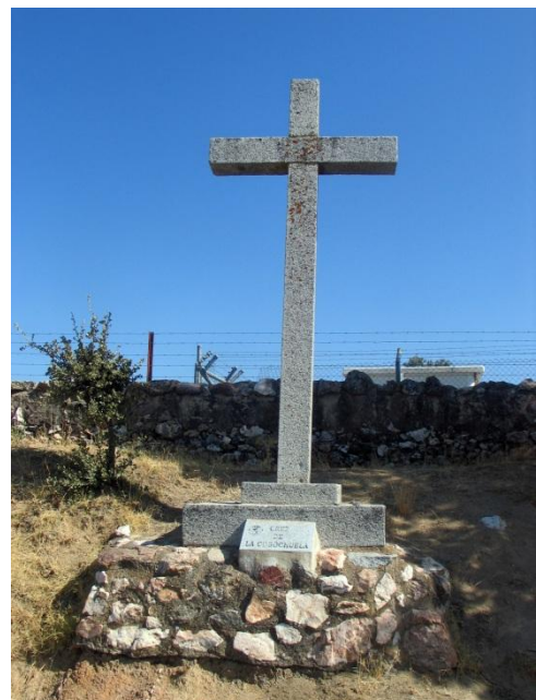
Fotografía actual de la “Cogochuela”

Tiene carácter religioso ya que el día de la “romería de traída”, la cofradía de la Virgen de Luna realiza una parada en este lugar produciéndose una descarga con bandera desplegada por parte de los hermanos de la virgen.