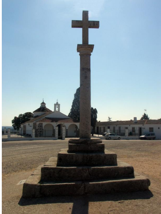
Fotografía actual de la "Cruz del Santuario de la Virgen de Luna"

Ubicada en la explanada del Santuario de la Virgen de Luna está ligada a la tradicional romería de la traída y llevada de la virgen desde Pozoblanco. Fue erizada en el año 1642, pero la cruz original fue robada en 1936 por una Brigada Internacional en la guerra civil española.