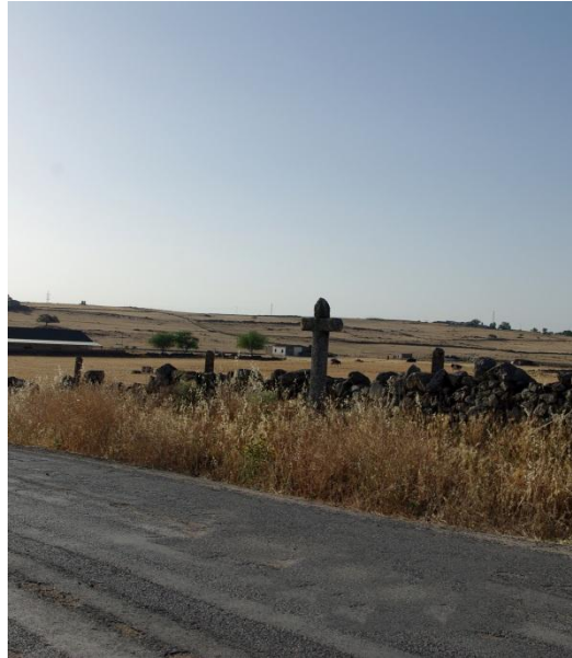
Fotografía actual de la "Cruz Camino del Mohedano"

Cruz situada en el margen izquierdo del camino del Mohedano, en el punto kilométrico 3. Según la rumorología popular esta cruz se erigió para señalar el lugar donde se produjo un accidente que causó la muerte de un hombre.