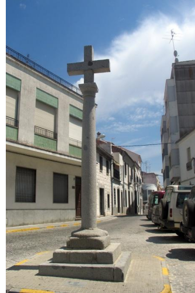
Fotografía actual de la "Cruz del Risquillo"