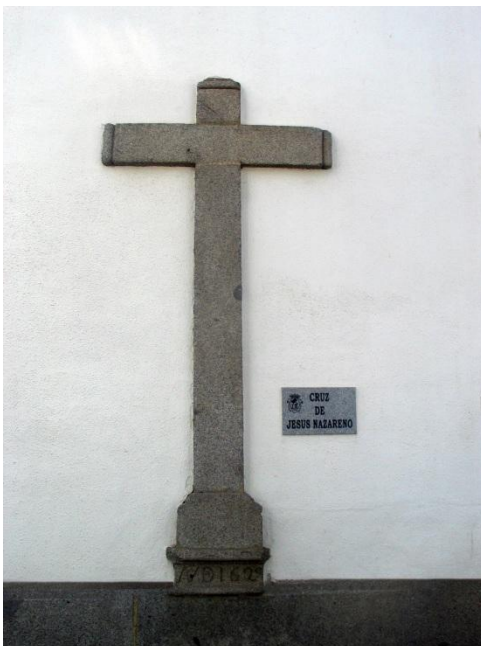
Fotografía actual de la "Cruz de Jesús de Nazareno"

Erizada en 1629, se localizaba en el ciprés dentro del patio de acceso a la ermita de Jesús de Nazareno. En el 1930 esta ermita se derribó y se construyó la capilla tal y como se conoce en la actualidad.