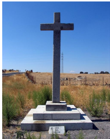
Fotografía actual de la “Cruz del Doctor”

El “Doctor” mientras se encontraba en su finca de retiro invernal “La Huerta del Gallo”, viendo que la muerte se le aproximaba dispuso a partir hacia su localidad natal, Pozoblanco, muriendo a las puertas del pueblo.