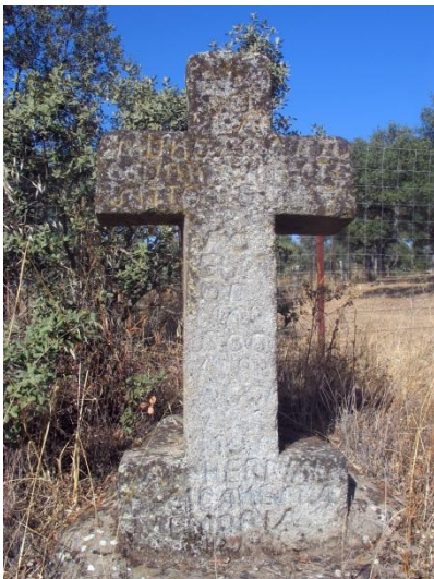
Fotografía actual de la “Cruz de Caña La Pila”

Cruz situada en el margen derecho de la carretera de la Canaleja que une Pozoblanco con Obejo, en el punto kilométrico 9,4.