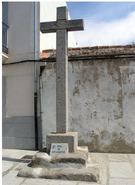
Fotografía actual de la "Cruz de los Lagartos"

Según la tradición el nombre de Cruz de los Lagartos proviene de una familia que vivía en las proximidades de la cruz y que eran conocidos en el barrio como "los lagartos".