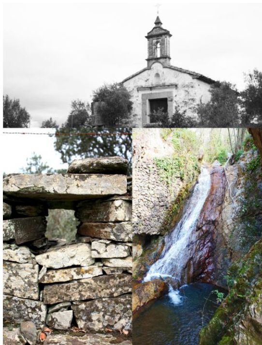
Lugares de interés ruta Pedrique - Pozoblanco

En esta publicación se muestran los lugares de interés situados en un mapa y con una explicación de la riqueza histórica, natural o artística que presenta cada punto.