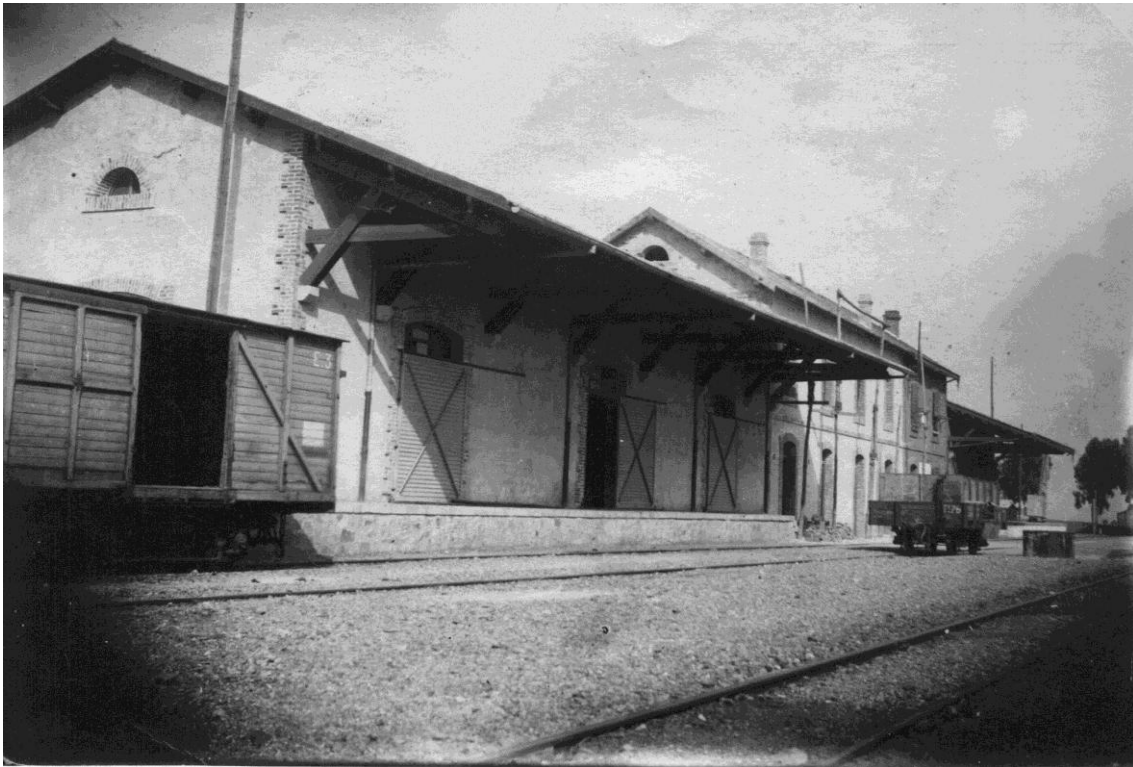
Estación del ferrocarril de Pozoblanco