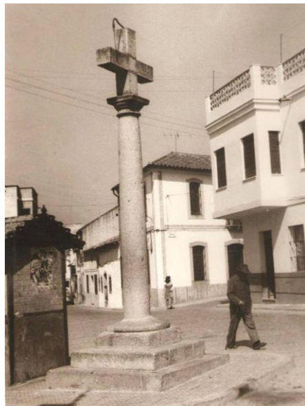
Cruz del Risquillo