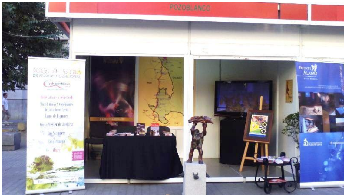
Stand Excmo. Ayuntamiento de Pozoblanco. II Muestra de Patrimonio Cultural de Córdoba y Provincia

Desde el 19 al 22 de Junio tuvo en lugar en la capital cordobesa la segunda edición de la muestra de patrimonio cultural de Córdoba y provincia, donde numerosas localidades de la provincia expusieron su riqueza patrimonial y cultural.