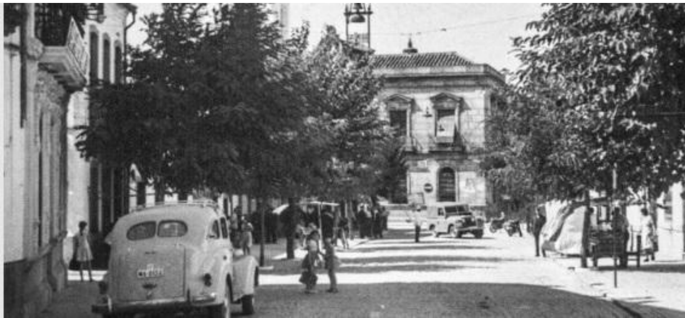
Pozoblanco, años 1970-1975

Ofrecer a nuestros hijos una ciudad amable, una ciudad segura, una ciudad caminable